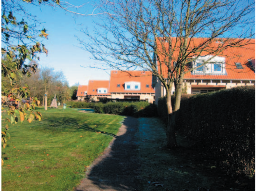
Midt igennem Fortunbyen øst løber en lang grøn kile. Et intimt uderum, der kan bruges på forskellig vis.