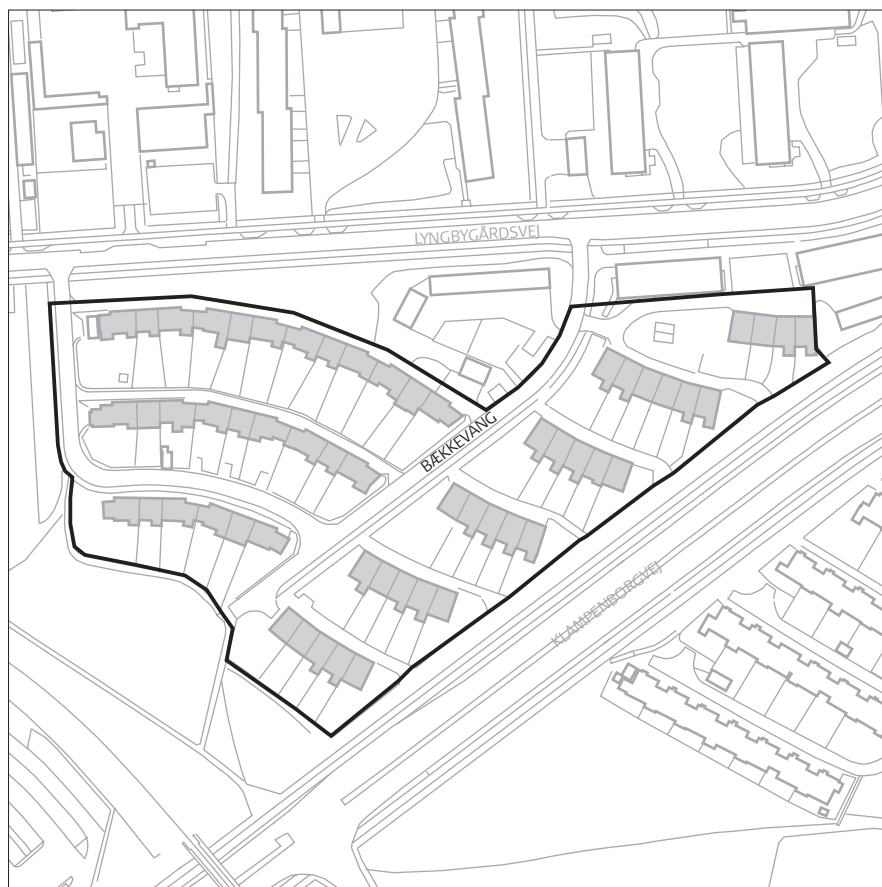
Bækkevang, mål 1:2.500