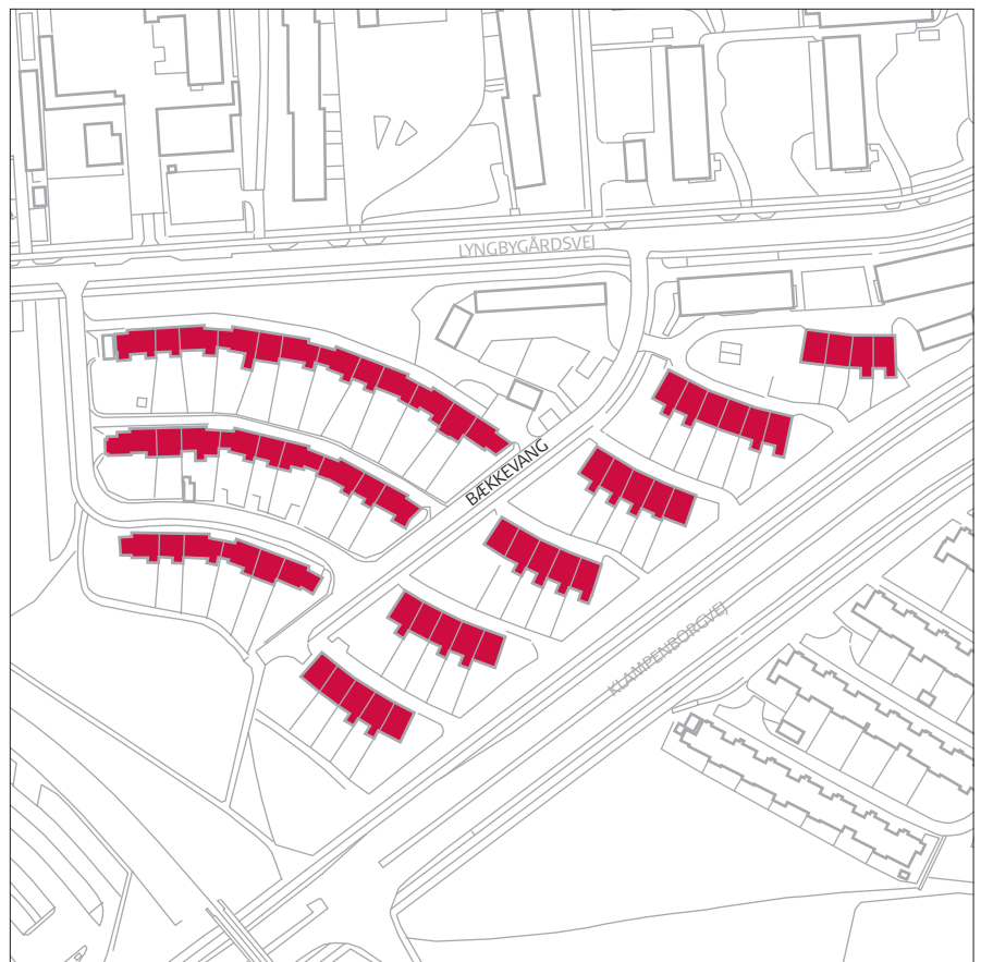
Bækkevang, bevaringsværdier mål 1:2.500