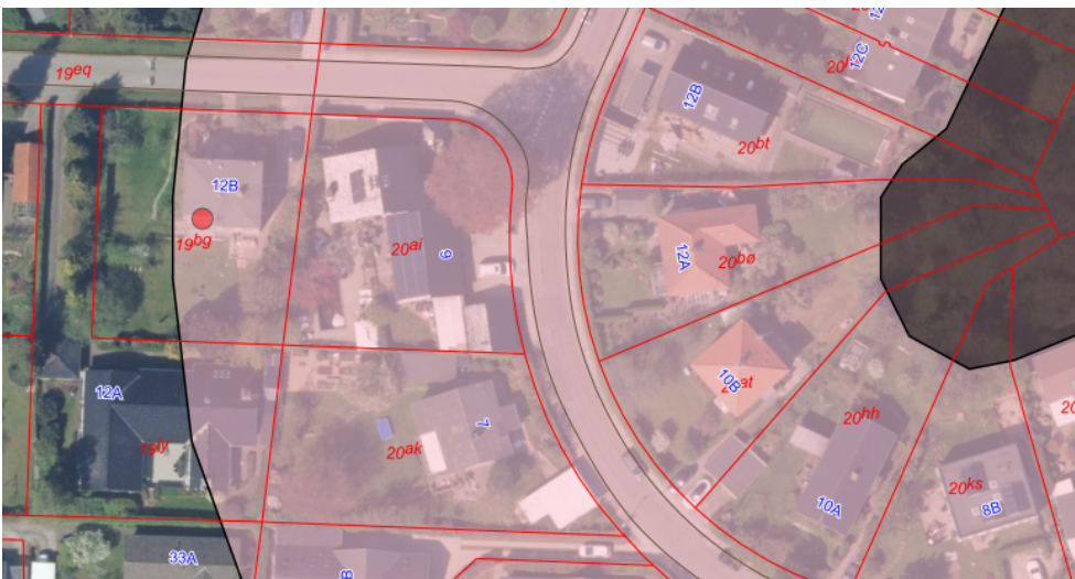
Figur 1 Luftfoto, som viser ejendommens placering i forhold til fortidsmindet.

Herunder vises oversigtskort for ejendommens beliggenhed (nr. 12B) i forhold til fortidsmindet (grå farve) samt beskyttelseslinjen (rød farve) samt kort med placering af carport, jf. ansøgning.