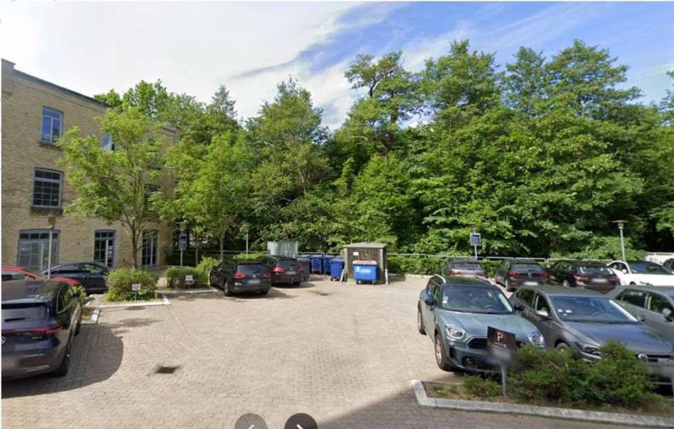
Billede 2; Streetview fra parkeringspladsen.

Transformerstationen vil blive placeret på et areal der er asfalteret hvor der i dag står skraldespande, venstre for den eksisterende transformerstation. Afstanden mellem de to transformerstationer vil være 1,5 m.