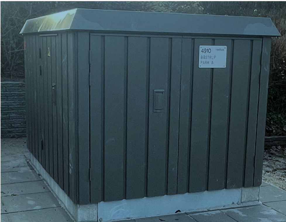
Billede 4; Billede af en lignende eksisterende transformerstation.

Der bliver etableret kabler fra bygningen syd for transformerestationen og hen til stationen samt videre til den eksisterende transformerstation. De vil blive gravet ned i jorden og ansøger oplyser at disse ikke vil give anledning til permanente terrænændringer i de berørte områder.