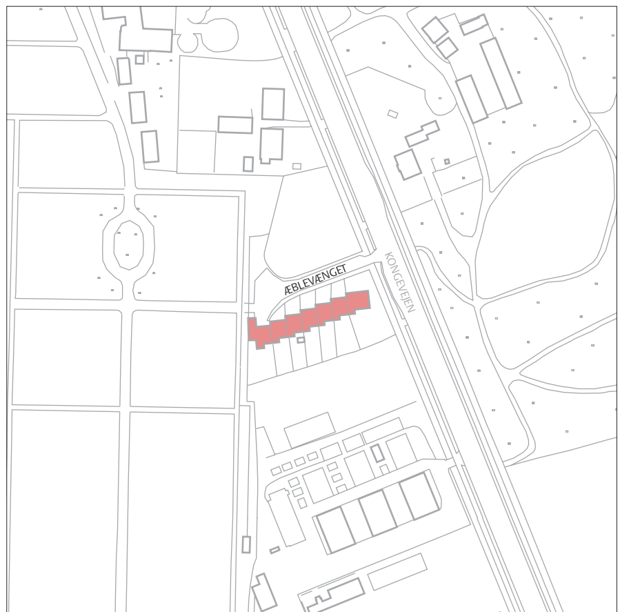
Æblevænget, mål 1:2.500