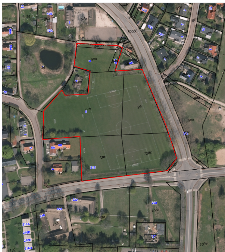
Figur 2: Matrikler omfattet af arealreservation til regnvandsbassin ved boldbaner i Lundtofte (nord for Lundtoftevej). Arealreservation blev inden høringsperiodens start (dvs. før 15. marts 2019) af Teknik- og Miljøudvalget udvidet til at omfatte matr.nr. 9eu, 9au, 9ar og 9av, 11n og 12ø, Lundtofte by, Lundtofte foruden matr. 9el, 12ac Lundtofte by, Lundtofte, som var Forvaltningens oprindelige forslag til arealreservation til spildevandsplantillægget.

Af forslaget, som har været i høring, fremgår at spildevandsplantillægget omfatter en reservation af et areal ved boldbanerne i Lundtofte (nord for Lundtoftevej) inden for hvilket, der kan udpeges 4.000 m 2 til regnvandsbassin (jf. nedenstående figur 2).