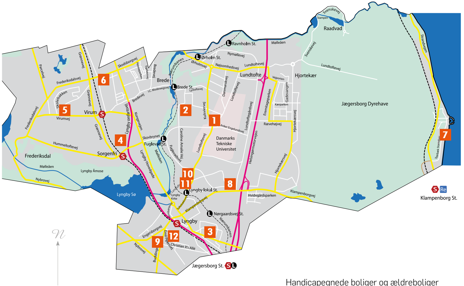
Handicapegnede boliger og ældreboliger