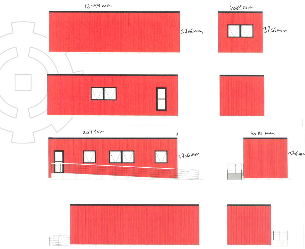
Figur 3. Facadeopstalter der viser de nye pavillonsbygninger, Modul 1 (øverst) og Modul 2 (nederst)