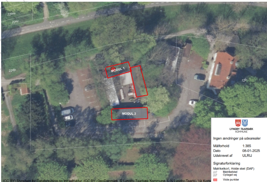
Figur 2. Situationsplan, der viser værestedets bygninger (markeret med rødt). De pavilloner, der udskiftes, er modul 1 og modul 2.

Værestedet består af tre pavillonsbygninger i én etage med rødmalet (svensk rød) træbeklædning, hvidmalede vinduer og flade tagpaptage samt en pergola i træ. Pavillonerne er opstillet på punktfundamenter. Pavillonerne har ifølge BBR-registeret et samlet etageareal på ca. 130 m 2 . Pavillonerne afgrænser sammen med træhegn og beplantning en gårdsplads, der er ugenert for forbigående, jf. figur 2.