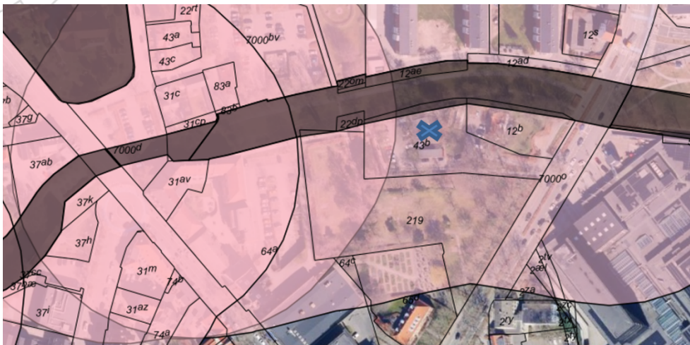
Figur 4. Udrækning af fortidsmindebeskyttelseslinjer afkastet af de fredede fortidsminde Fæstningskanalen. Værestedet er markeret med blåt kryds.

Hele ejendommen Toftebæksvej 9 er omfattet af naturbeskyttelseslovens fortidsmindebeskyttelseslinje (§ 18) afkastet af det fredede fortidsminde Fæstningskanalen (frednings nr. 3030162), som er beliggende umiddelbart nord for de eksisterende pavilloner (bilag). Fæstningskanalen er en del af Københavns Nyere Befæstning, som blev etableret i perioden 1880-1890. Fæstningskanalen blev registreret som fortidsminde i 1991, jf. figur 4.