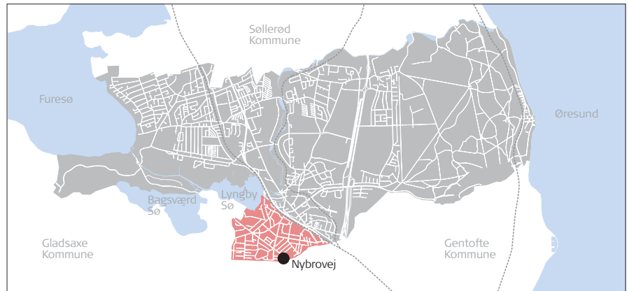
Rækkehusenes beliggenhed i Lyngby-Taarbæk Kommune

Opførelsesår: 1954 Bygherre: Arkitekt: Leif Olsen Antal boliger: 4