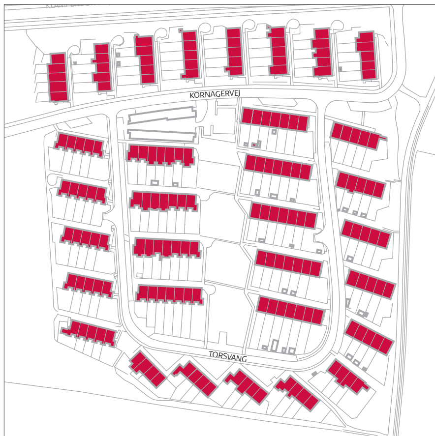
Kornagervej, Torsvang, bevaringsværdier mål 1:2.500