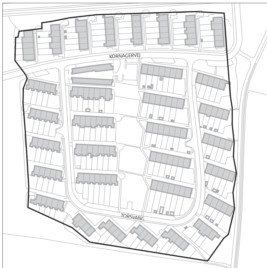
Kornagervej, Torsvang, mål 1:2.500