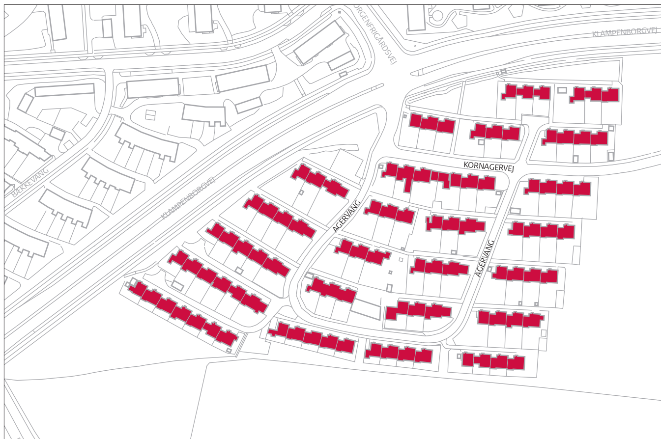
Kornagervej, Agervang, bevaringsværdier mål 1:2.500