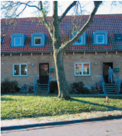
Mange steder i bebyggelserne findes små grønne områder.