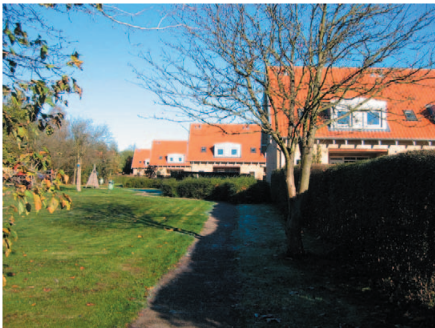
Midt igennem Fortunbyen øst løber en lang grøn kile. Et intimt uderum, der kan bruges på forskellig vis.