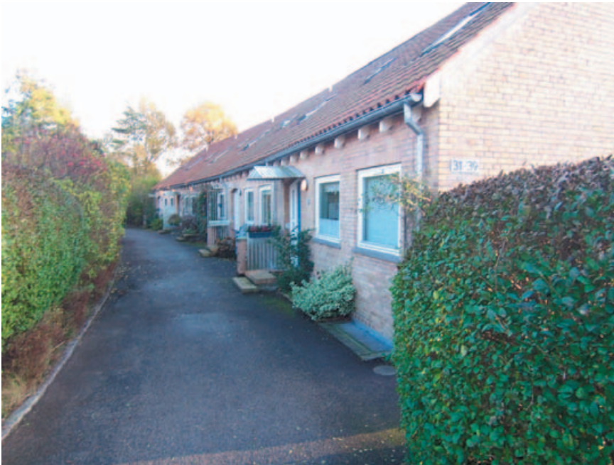
Bækkevang I, rækkehusstokkene følger landskabets form.