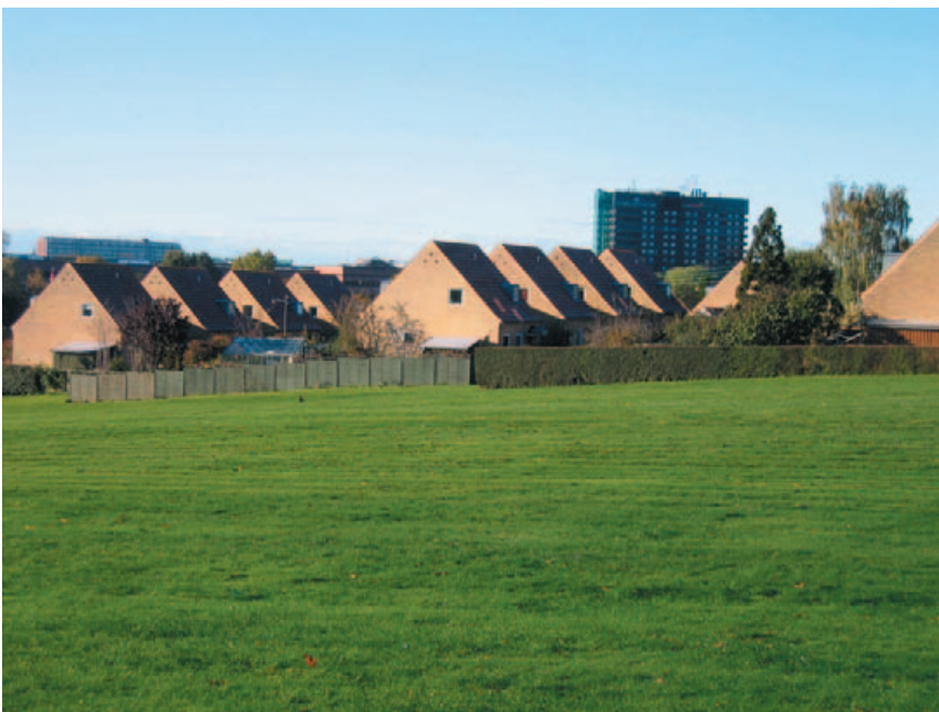
Rækkehusbebyggelsen set fra grønningen mod vest. I baggrunden ses hotel Eremitage.

Den velformede bebyggelse ligger placeret på et sydskrånende terræn ned mod Ermelundskilen. Rækkehusstokkene er placeret parallelt med de øst-vestgående højdekurver og understreger dermed landskabets hovedtræk. Set fra Ermelundskilen fremtræder bebyggelsens tage med et smukt relief.