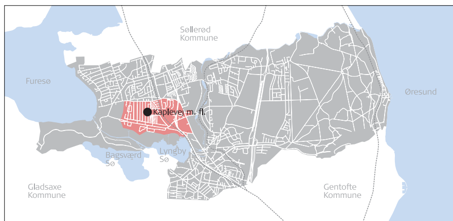
Rækkehusenes beliggenhed i Lyngby-Taarbæk Kommune

Bebyggelsen rummer i alt 202 boliger, hver med et bebygget areal på mellem ca. 70 og ca. 90 m 2 , afhængig af hvilken type, der er tale om. Bebyggelsen er opført i 1942-48