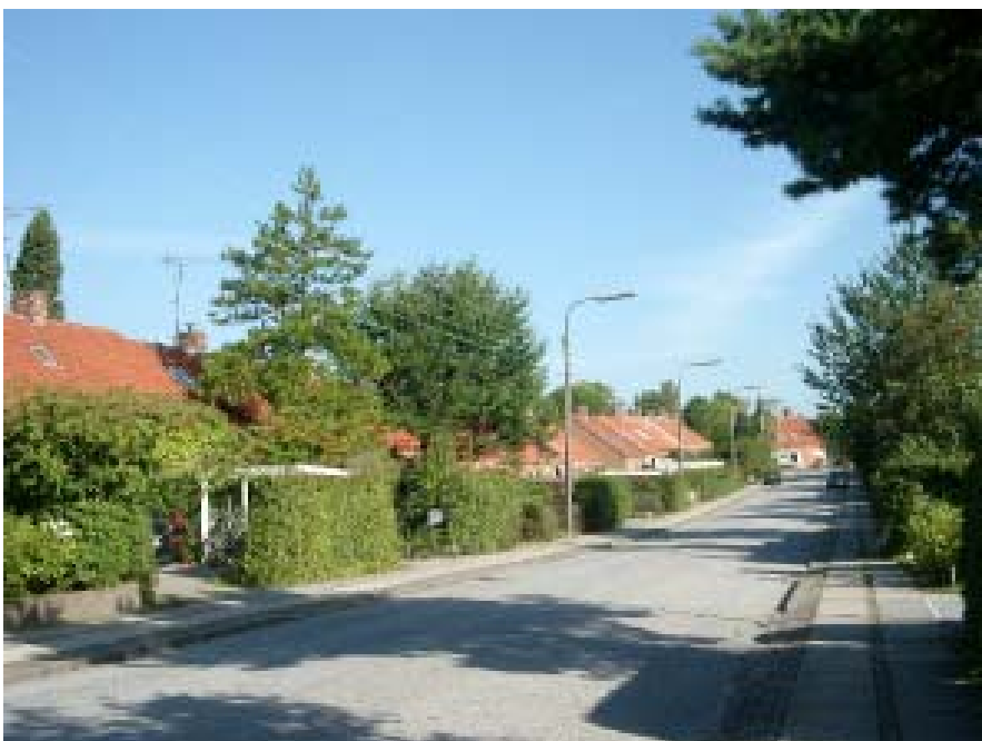
Kaplevej, vestside set mod nord

med Thorvald Dreyer som arkitekt. Husene er i 1 etage med delvis kælder og med facader i røde teglsten (Kaplevej og Rosengårdsvej) mens der er anvendt gule teglsten på Bygdevej. Tagene er dækket med røde tagtegl, men der er sket en del udskiftninger, også til beton-tagsten. Der er udført en del tilbygninger, isat nye ovenlysvinduer og kviste af varierende størrelse og udformning. Endvidere er der opført garager og carporte samt terrasseoverdækninger.