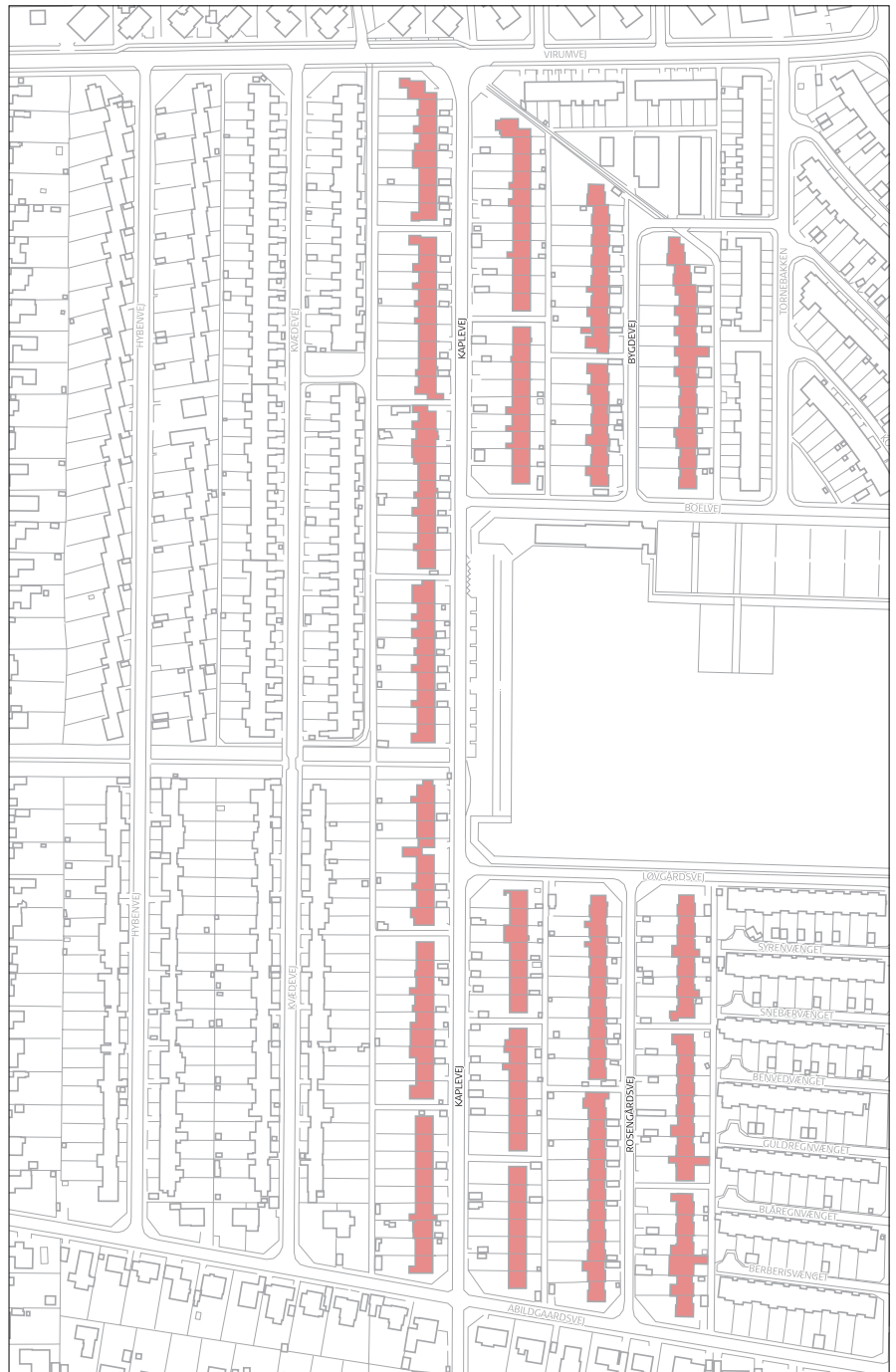
Kaplevej m.fl., bevaringsværdier mål 1:4.000