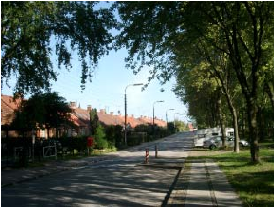
Kaplevej set mod nord, udfør idrætsplads