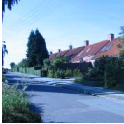
Rosengårdsvej, vestside set mod syd