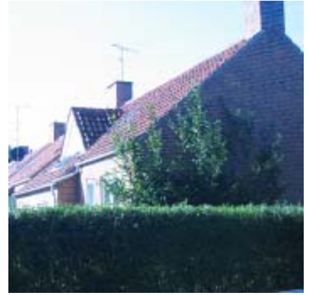
Rosengårdsvej, haveside af boliger set mod syd