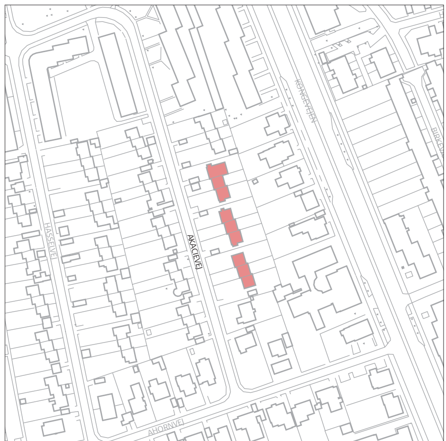
Akacievej, mål 1:2.500