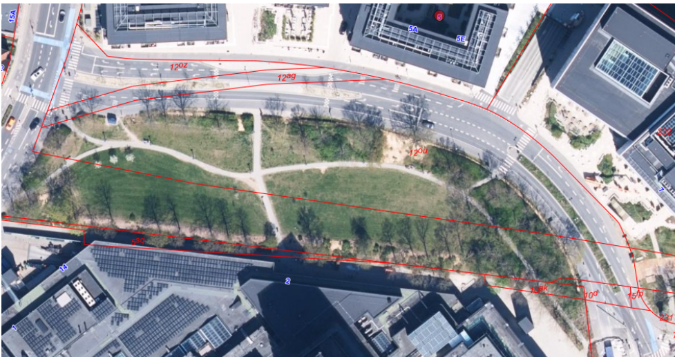
Figur 1. Oversigtskort over Kanalparken og nærmeste område. Luftfoto 2023.

Byggepladsen skal etableres i forbindelse med totalrenovering af højhuset på toppen af Lyngby Storcenter. Byggepladsen placeres på det grønne areal mellem Toftebæksvej, Kanalvej og Lyngby Storcenter. Det forventes, at byggepladsen skal være etableret til udgangen af 2026.