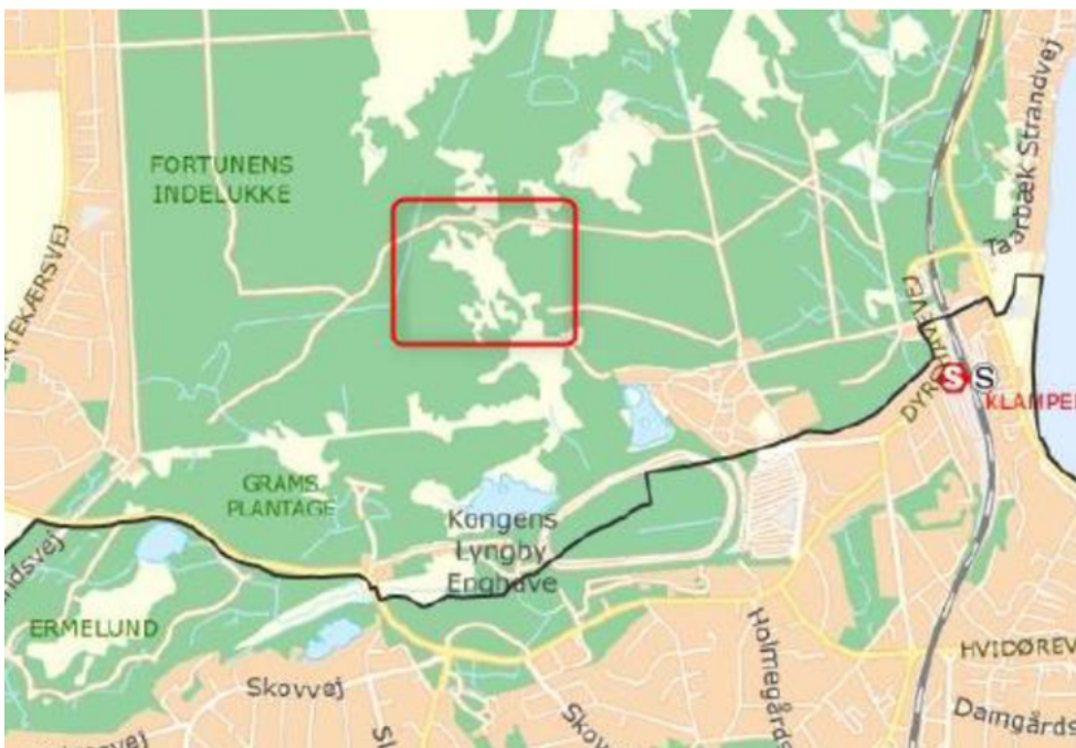
Figur 1. Oversigtskort med rød markering af projektområde.

Ulvedalene ligger i Jægersborg Dyrehave ca. 600 meter nordøst for Kirstens Piils Kilde. Terrænet er markant med stejle skråninger. I Ulvedalene har der fra 1910 til 1949 været gennemført friluftsteater i sommerperioden. I nyere tid har der været forestillinger i årene 1996, 1998, 2000, 2002, 2004, 2006, 2010, 2013, 2016, 2018, 2021 og senest 2023.