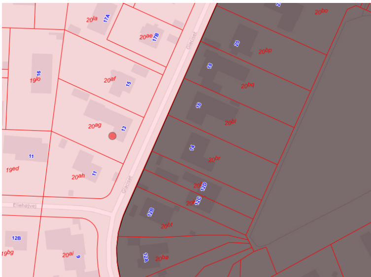
Figur 1 Luftfoto, som viser ejendommens placering i forhold til fortidsmindet.

Herunder vises oversigtskort for ejendommens beliggenhed (nr. 13) i forhold til fortidsmindet (grå farve) samt beskyttelseslinjen (rød farve) samt kort med placering af drivhus, jf. ansøgning.