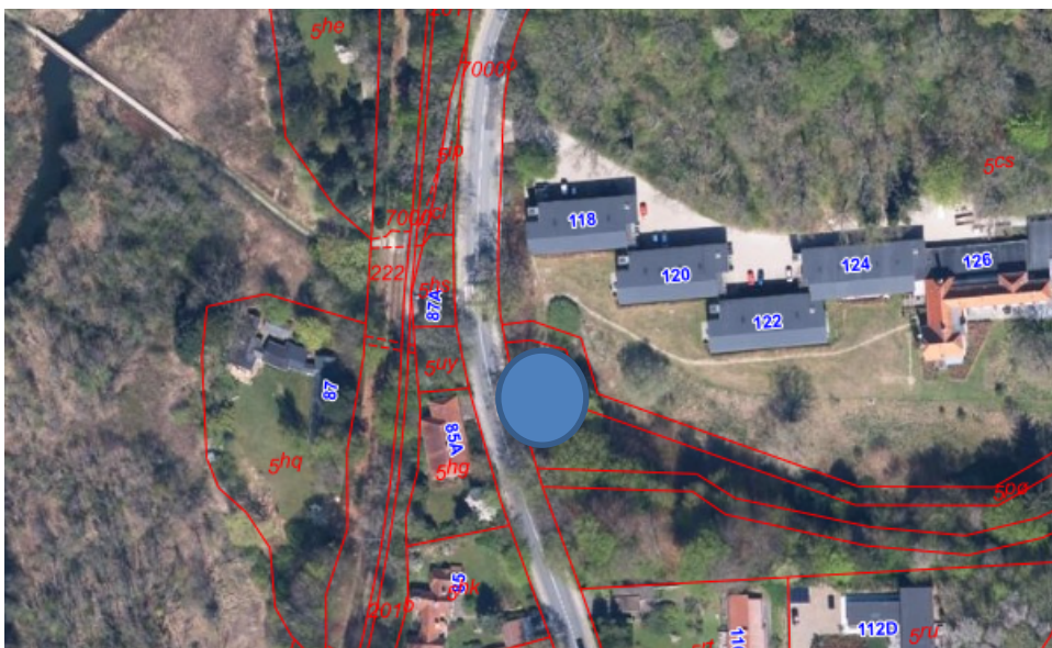
Figur Error! Bookmark not defined. Oversigtskort. Projektområde er markeret med blå.

Den nye adgangsvej til olieudskilleren fra Caroline Amalie Vej består af et nyt trappeanlæg i træ, som optager et terrænspring på ca. 2.40 meter. Der hvor trappeanlægget ønskes placeret, er der i forvejen et bøgepur, der står på en skrænt. For at trappen kan overholde arbejdstilsynets krav, er det nødvendigt at udjævne skrænten under og omkring trappen.