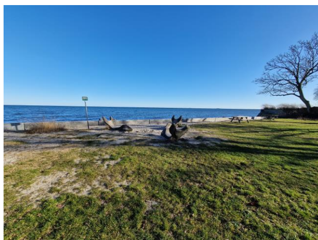
Stranden ved Bombegrunden (februar 2023)