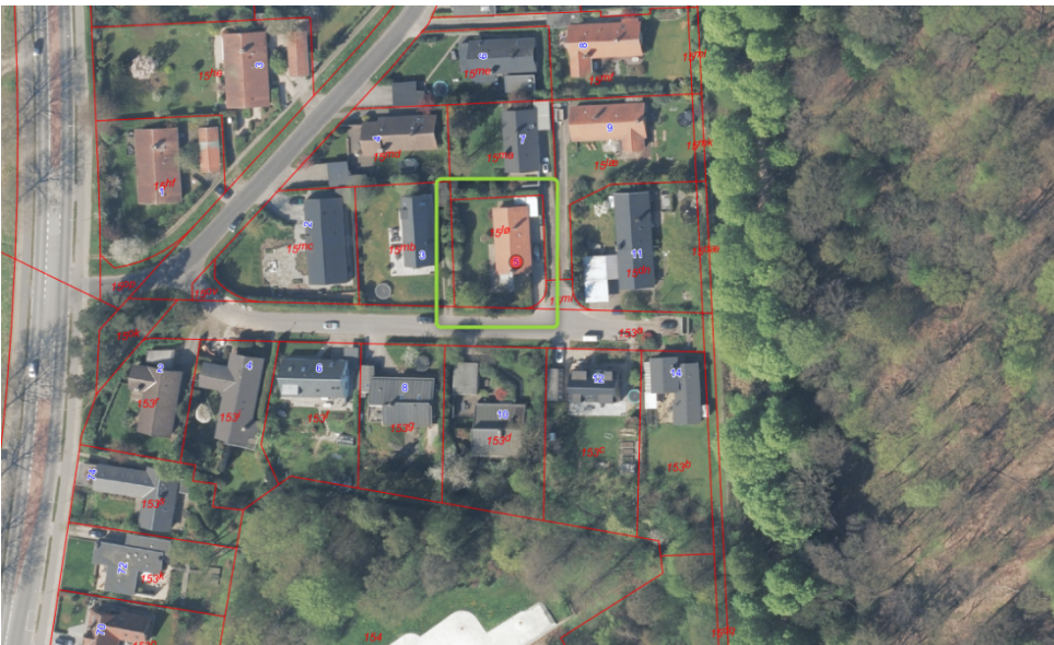
Figur 1. Luftfoto, som viser ejendommens placering. Ejendommen Boveskovvej 5 er markeret med grønt rektangel.

Ejendommen Boveskovvej 5, matrikel nr. 15LØ Kgs. Lyngby By, Lundtofte har et areal på 710 m 2 . Der er opført et fritliggende enfamiliehus på 132 m 2 , en carport på 22 m 2 og et overdækket areal på 15 m 2 .