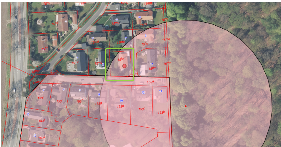
Figur 3. Udstrækning af fortidsmindebeskyttelseslinjen (lyserød flade) afkastet fra skålsten. Ejendommen Boveskovvej 5 er markeret med grønt rektangel.

Næsten hele ejendommen Boveskovvej 5 er omfattet af fortidsmindebeskyttelseslinjen afkastet af den fredede skålsten (frednings nr. 3030:174). Der er flere ejendomme, herunder et familiehus beliggende mellem skålstenen og ejendommen Boveskovvej 5. Skålstenen er placeret ca. 10 m inde i Dyrehaven (skoven) og ca. 80 m fra den ansøgte tilbygnings østfacade. Skålstenen er fra bronzealderen. Den er ca. 35 cm høj og indeholder mindst 25 skåltegn.