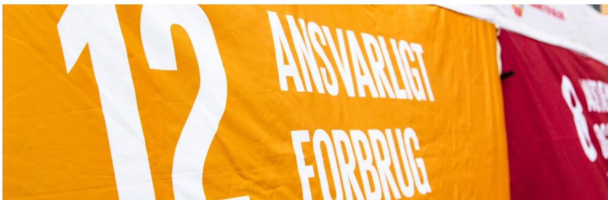
Det 12. verdensmål.