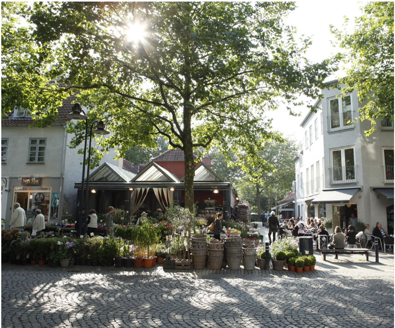
Lyngby Hovedgade.

Erhvervslivet er fortrolig med alle de muligheder kommunen tilbyder i forhold til rekruttering af den nødvendige arbejdskraft. Gennem et tættere samarbejde med byens uddannelsesinstitutioner, har vi sikret de relationer, der kan koble og fastholde de nye kandidater til kommunens virksomheder.