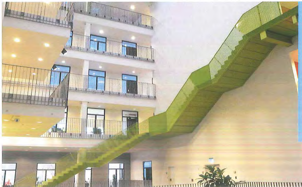
Lyngby-Taarbæk Kommune Lyngby Rådhus, Lyngby Torv 17 2800 Kgs. Lyngby

Bascon A/SÅboulevarden 21Postbox 510DK-8100 Aarhus C